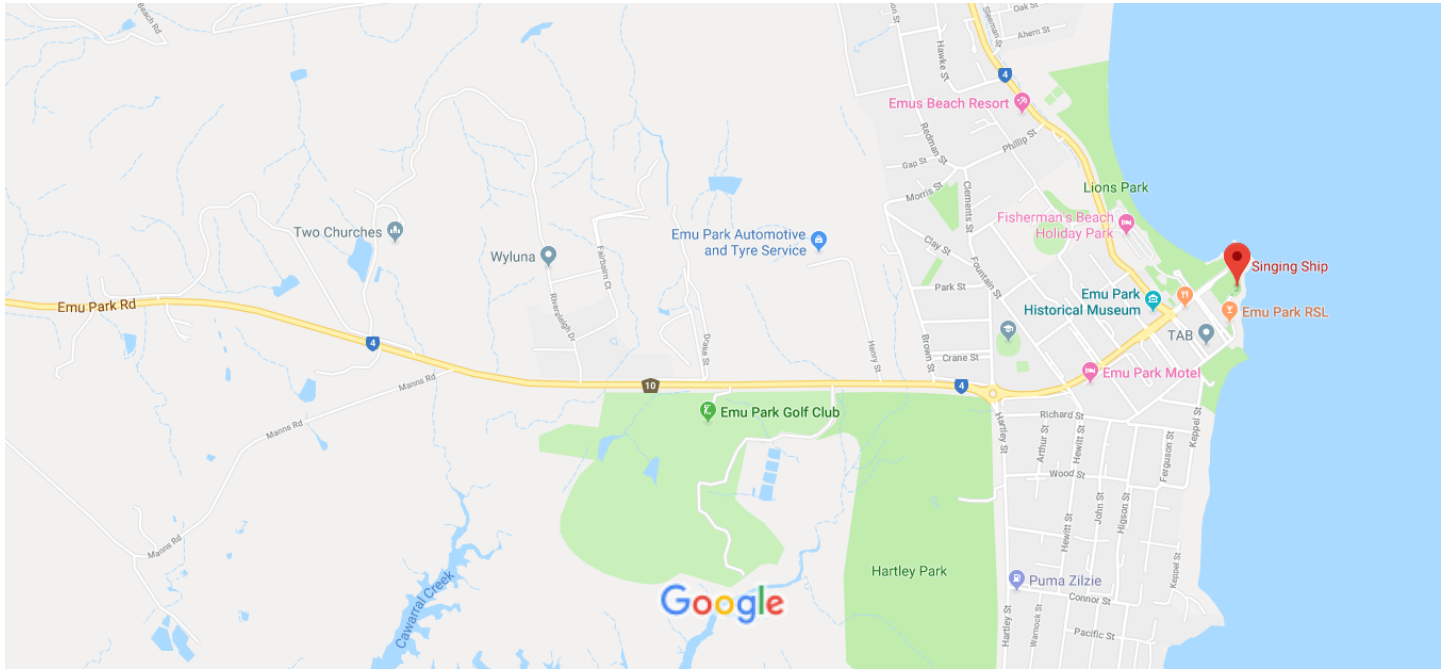
Données cartographiques ©2019 500 m